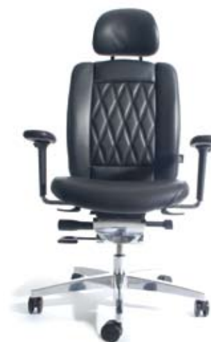
AluMedic® Limited „S“

AluMedic® Ltd. „S“ Aktionspreis ab € 1.499,- inkl. MwSt.